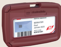
Dosimètre de criticité Mesure des fortes doses en situation accidentelle.