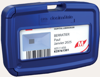
Dosimètre et coque réutilisables

Convertisseur en polypropylène pour augmenter la sensibilité aux neutrons rapides. (réactions (n,p) )