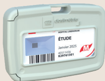
Dosimètre Étude de poste